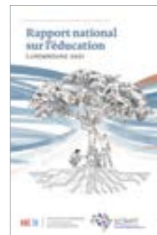
Rapport national sur l'éducation - Luxembourg 2021