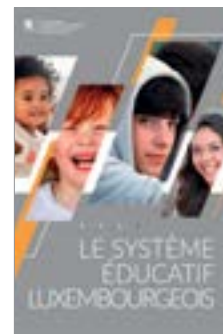
Le système éducatif luxembourgeois 2023